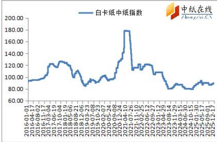
图 1：白卡纸中纸指数走势图