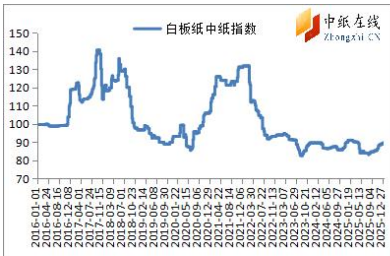
图 3：白板纸中纸指数走势图